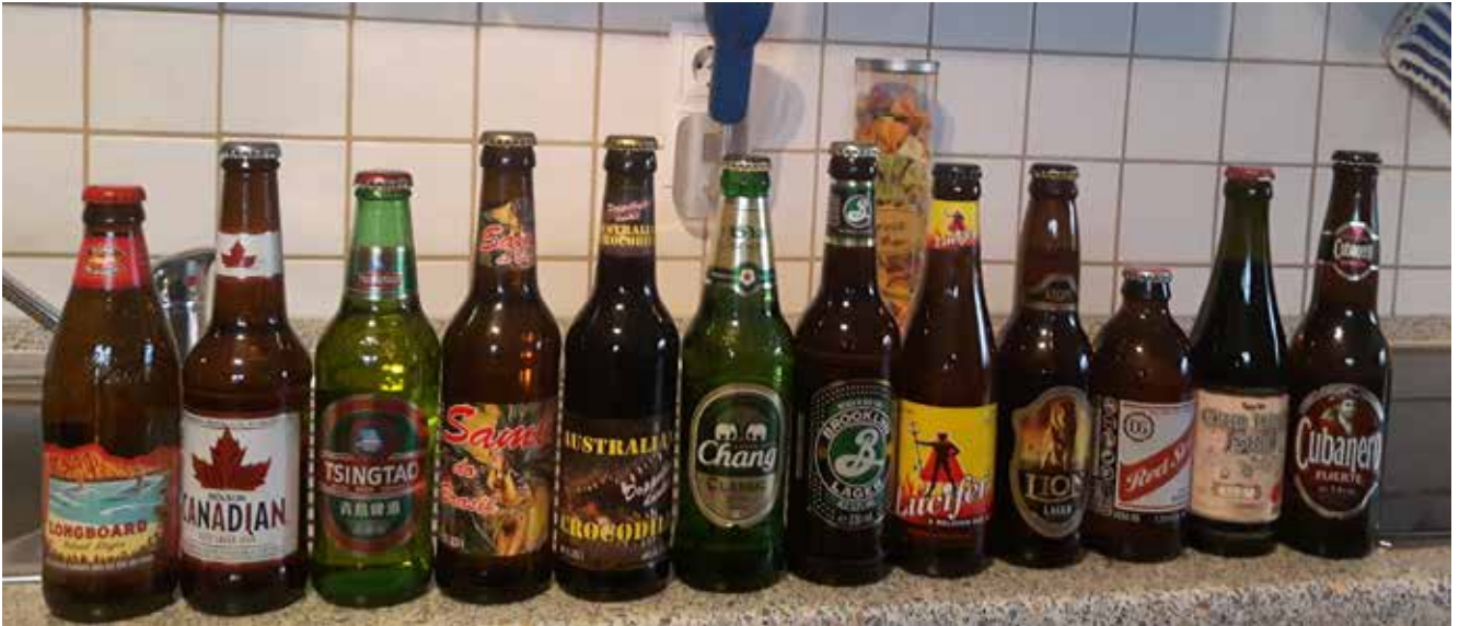
Bunte Auswahl: die Biere aus aller Welt.

Jeder bekam einen Bewertungsbogen, bei dem so wichtige Dinge wie Konsistenz, Schaum und natürlich Geschmack, aber auch das Design/Etikett der Flasche oder Preis/Leistung bewertet wurden.