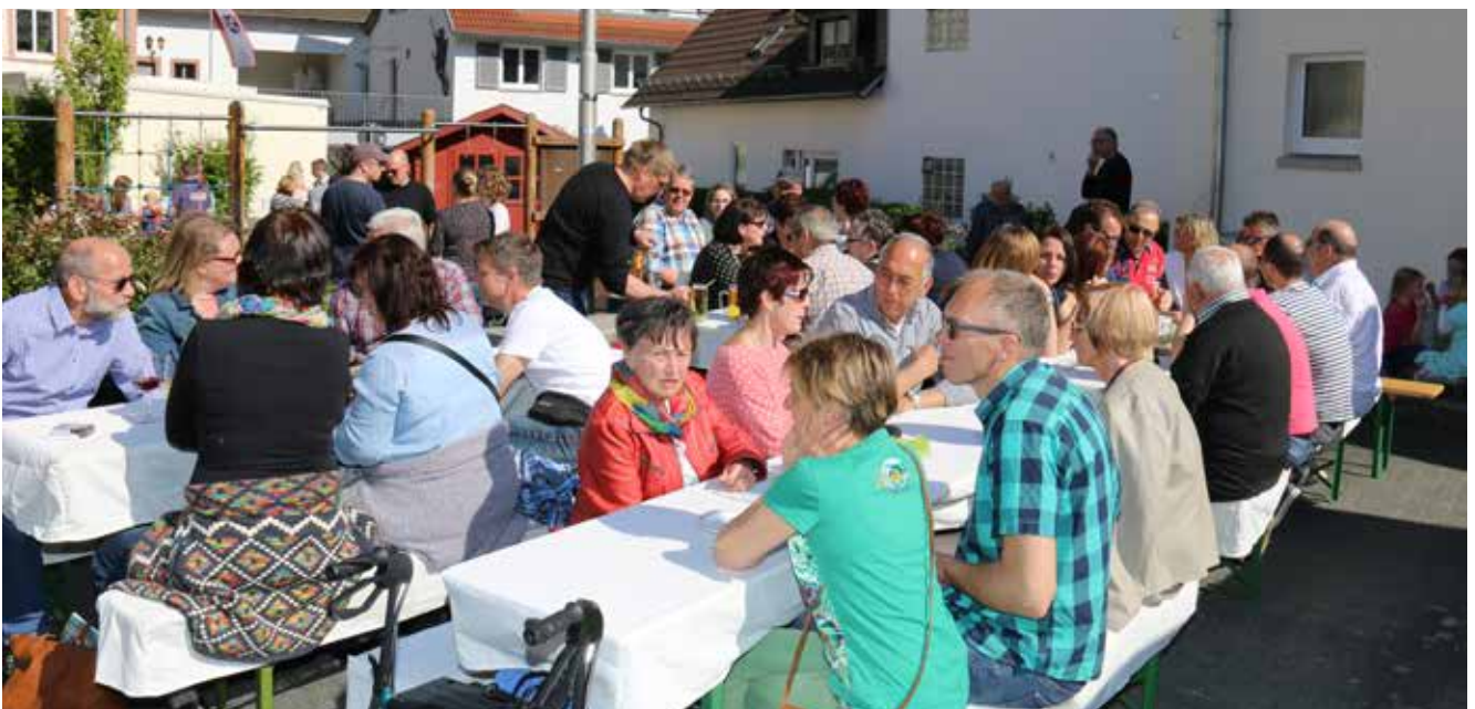
Stets gut besucht ist das „Café Sellemols“ am unteren Ende des Schulhofs.