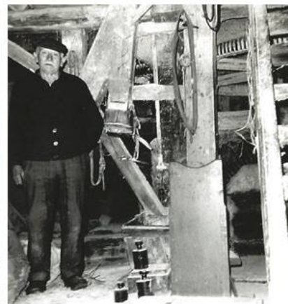
Der letzte Müller um 1950