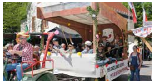
Die „Wasserschöppler“ schafften es mit ihrer tollen Brücke erneut aufs Podium. Platz drei: ein Gutschein über 20 Euro vom Brauchtumsverein.