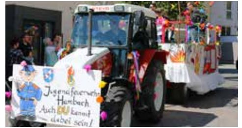
Der zweite Preis ging an die Jugendfeuerwehr Hambach mit knallbuntem Wagen und flammendem Appell zum Mitmachen. Lohn: ein 30-Euro-Gutschein vom Brauchtumsverein.