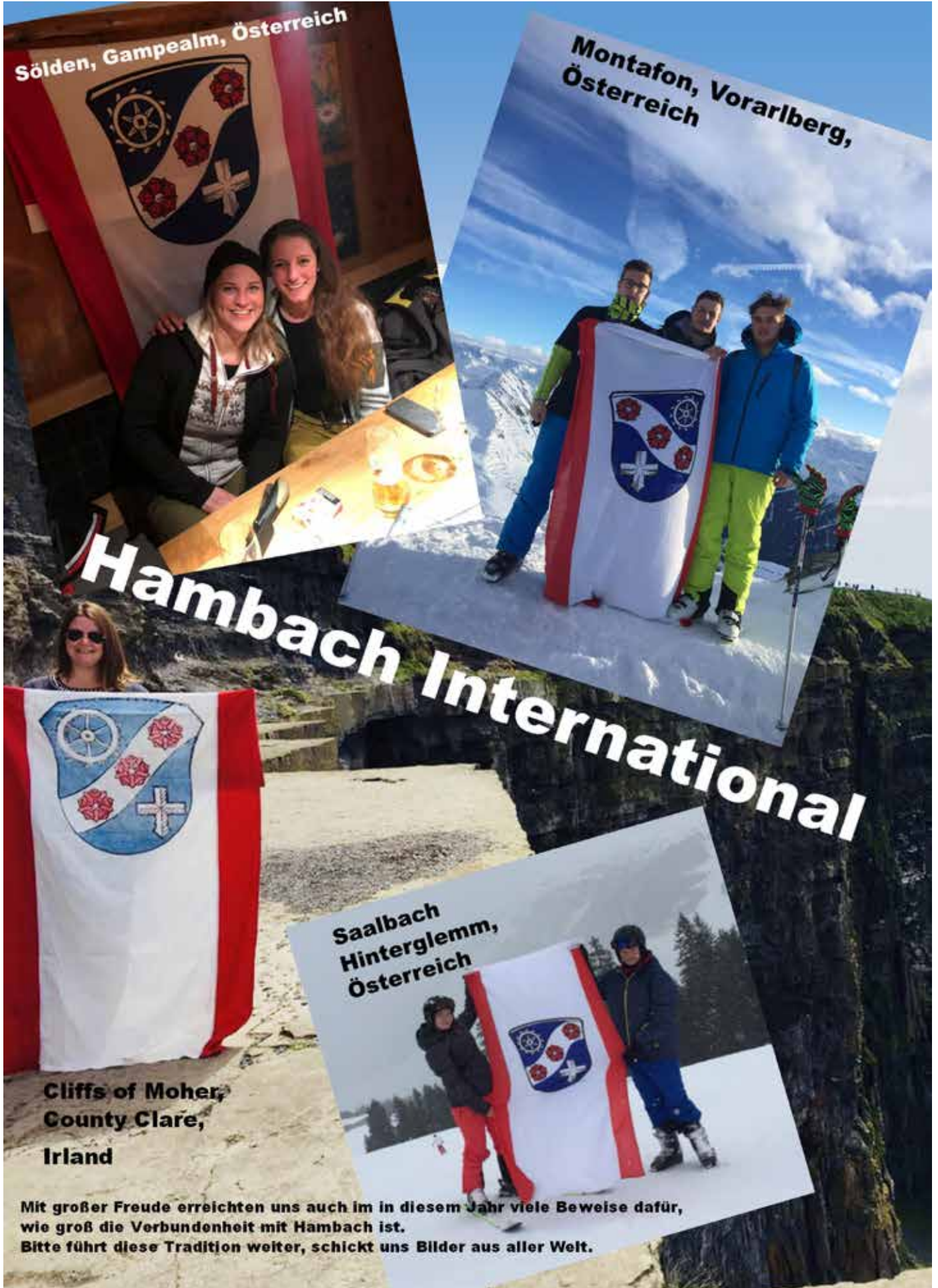
Sölden, Gampealm, Österreich