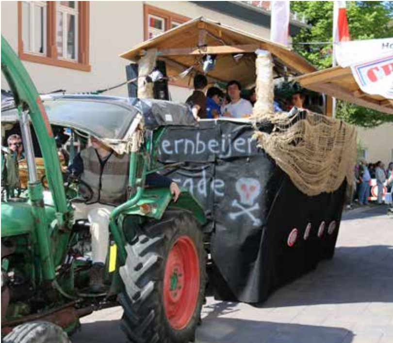
Die „Kernbeijerbuwe“ gewannen den ersten Preis: einen 50-Euro-Verzehrgutschein im Gasthaus „Zur Rose“. Sie rollten mit einem Piratenschiff durchs Tal der Rosen.