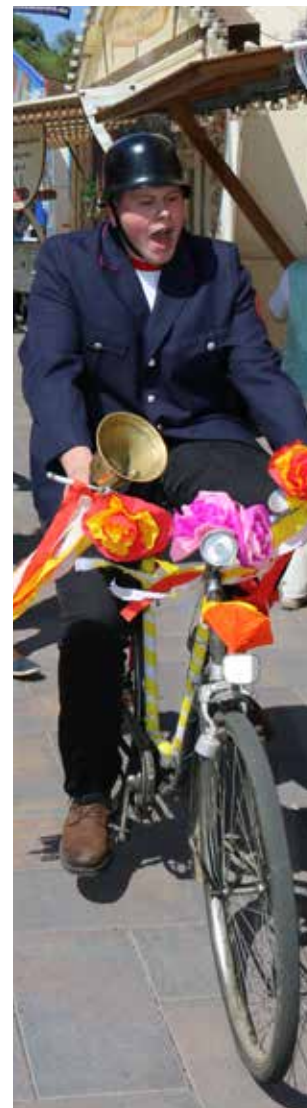
Auf unsere Polizeidiener ist seit Jahren Verlass!