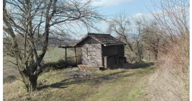
Aktueller Zustand des Hüttchens ...

Die aktuelle Situation sieht jedoch leider etwas anders aus. Das Hüttchen hat seinen alten Charme verloren und steht nun etwas ramponiert und verlassen auf der Höhe. Einzig die Hornissen freuen sich, dass sie ein neues Heim gefunden haben.