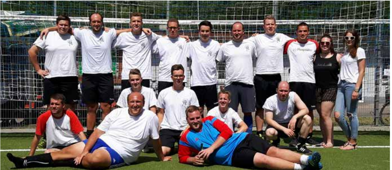
Breit und schön: das Team der Kerwejugend beim Hobbykicker-Turnier.

halten musste wie Weinflaschen in seiner Kerwesucherkarriere.