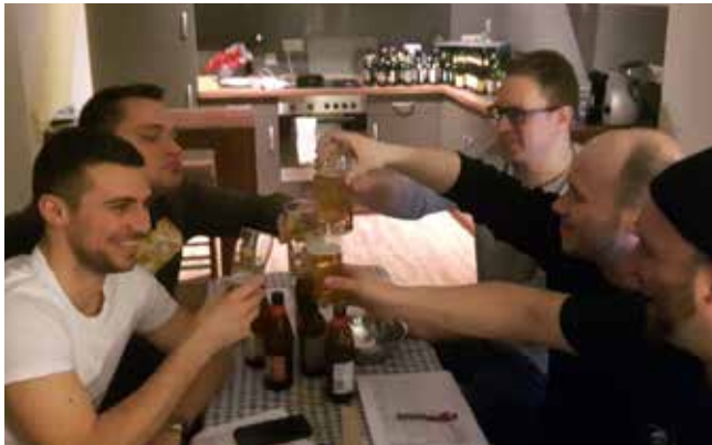
Konzentriert bei der Arbeit für wissenschaftliche Erkenntnisse.

Gesagt getan. So fand man in Windeseile 9 Mitglieder der Hambacher Kerwejugend,