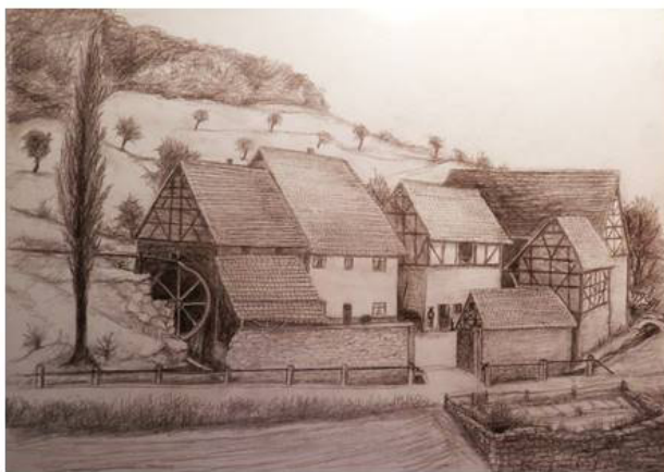
Gemälde mit der Schweinsbergersmühle