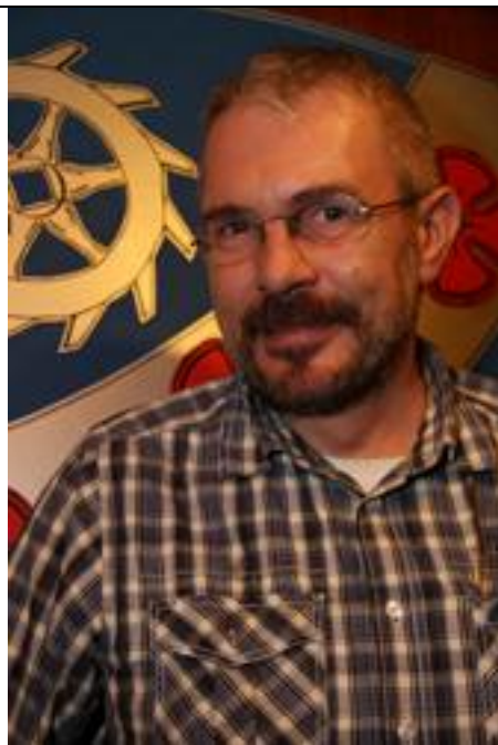
Verfasser: Nino Piazza

Herzlich willkumme ehr liewe Leit, egal fun wu ehr heit kumme seid. Ob fun Hoamboach, Kerschause, orrer Erboch, fun Hepprum orrer Wald-Erleboch, ich will hier gar koanz gonz verdriese, drumm alle Leit hier herzlichst grieße!